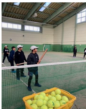
しっかり真ん中に当てる！